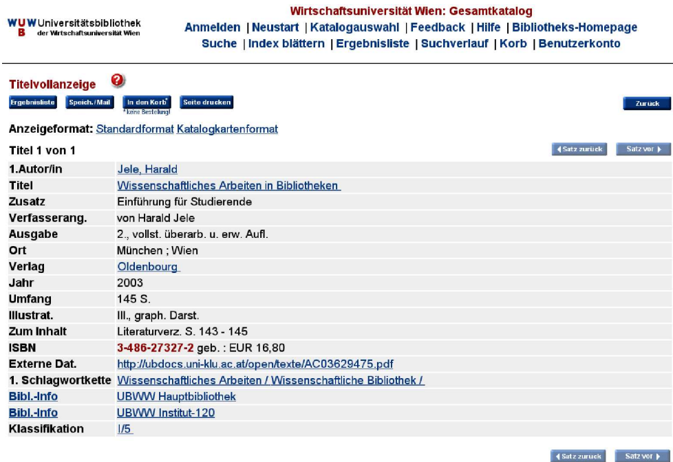
Abbildung 9.3: Vollanzeige des bibliographischen Datensatzes nach X-Linking in der Zieldatenbank (Online Katalog der Bibliothek der Wirtschaftsuniversität Wien, realisiert mit dem Produkt SFX)