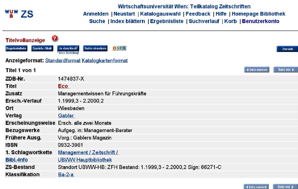
Abbildung 9.4: Vollanzeige eines bibliographischen Datensatzes aus dem Teilkatalog Zeitschriften der Bibliothek der Wirtschaftsuniversität Wien

Dass X-Links in Systemen mitunter angeboten werden können, ohne dass diese auf tatsächliche Ergebnisse zeigen, ist ein wesentlicher Nachteil solcher Systeme. 30