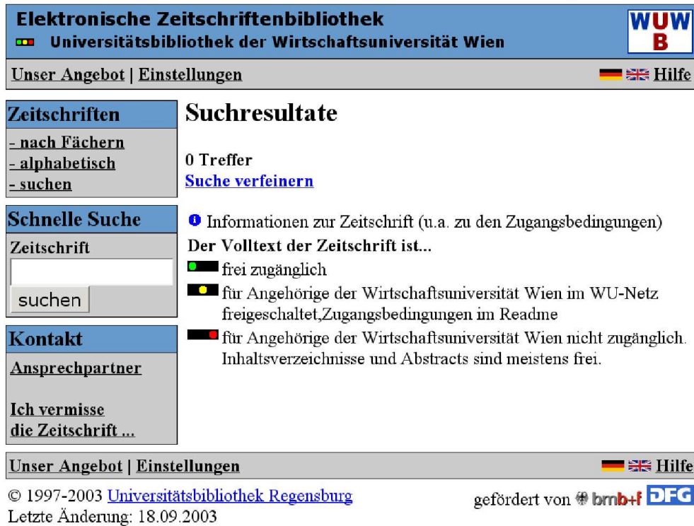
Abbildung 9.6: Anzeige der Zieldatenbank (EZB, Die Elektronische Zeitschriftenbibliothek der Universitätsbibliothek Regensburg), der zu entnehmen ist, dass das X-Link-Angebot zum Treffer der Startdatenbank zu keinen passenden Ergebnissen geführt hat